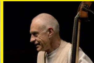
Gary Peacock Trio