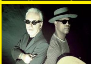
Eric Bibb / Jean-Jacques Milteau