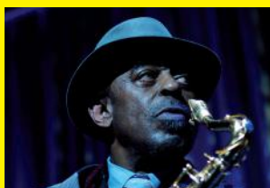
Archie Shepp 'Attica Blues Big Band'