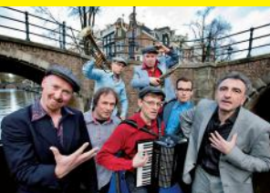
Amsterdam Klezmer Band