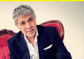
Monty Alexander Trio