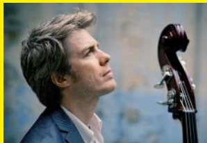
Kyle Eastwood Quintet