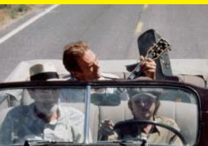
Honky Tonk Man